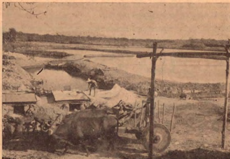
Depósito de agua salada que se prepara para llavar a las pails