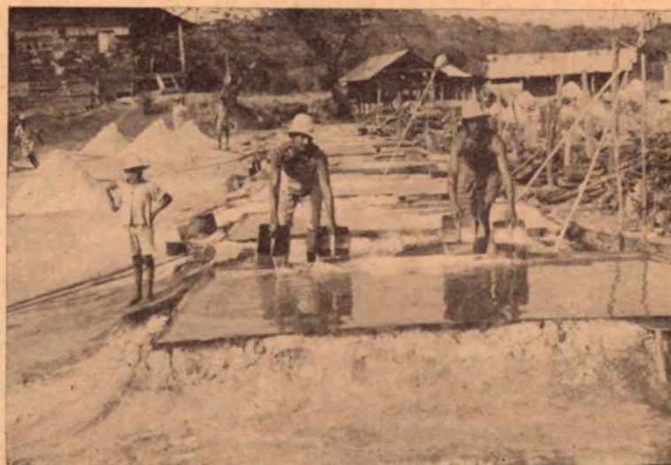
Serie de pails de cocer el agua salada cuando está de punto