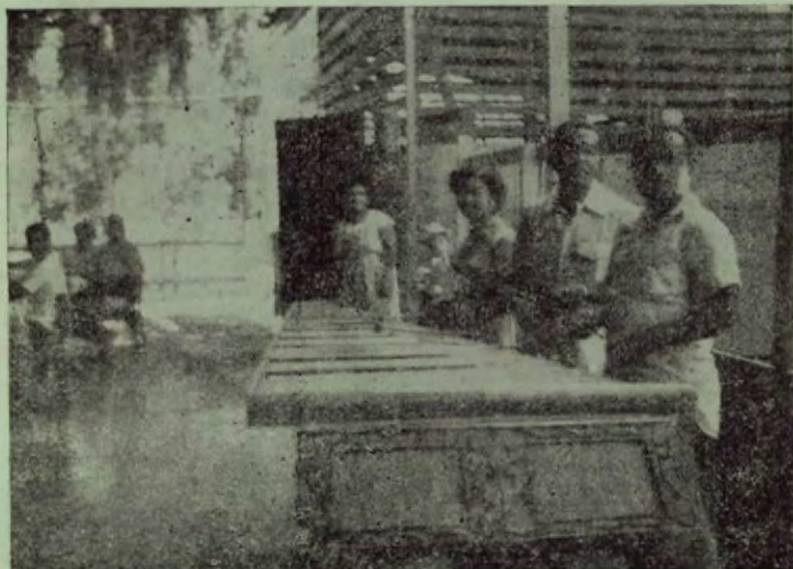
Una marimba alegre el ambiente e invita a la danza en la amplia pista de baile.

siempre a las gratas órdenes de su clientela y del turismo nacional y extranjero.