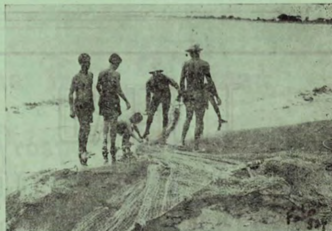
Todos los días, pescadores del hotel salen al mar, para abastecerlo de pescado fresco y de fina clase.