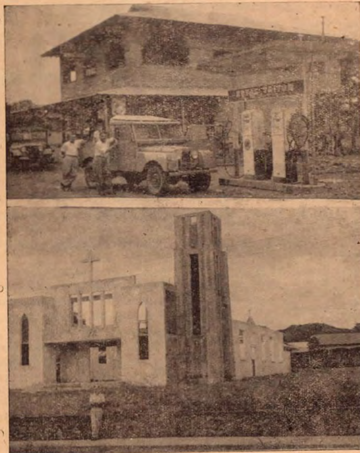
Entrada a La Irma, en Las Juntas de Abangares. El segundo cuadro es el nuevo templo en construcción

Las Juntas de Abangares siente el amparo de un grupo de hombres de acendrado espíritu progresista