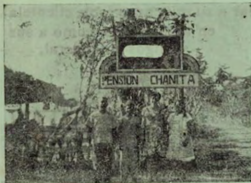
Una carretera bastante amplia lleva de la estación de El Roble hasta el hotel.