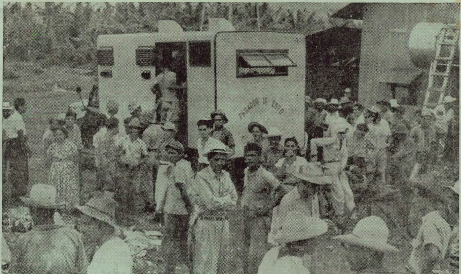
Un día de PAGO en las fincas bananeras de la zona de Coto, Cantón de Golfito