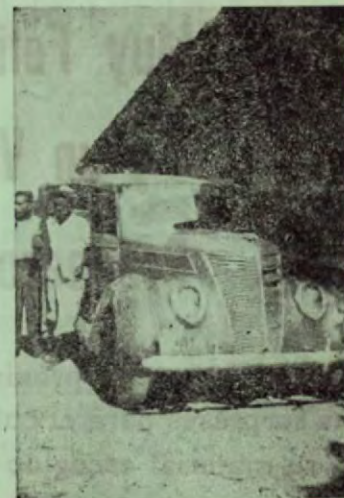
La camioneta siempre espera la llegada de los trenes en El Roble para conducir los turistas hasta La Boca de la Barranca.

Para sus reservaciones por carta o por telégrafo dirijase a HOTEL CHANITA, BOCA de la BARRANCA Por ferrocarril, bájese en EL ROBLE donde siempre hay una camioneta en espera de los turistas.