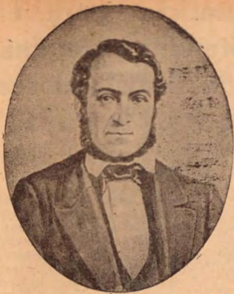
Don JUAN RAFAEL MORA