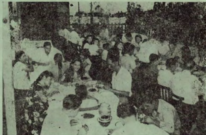
El salón comedor del hotel donde se sirve un menú de lo más variado, escogido y abundante.