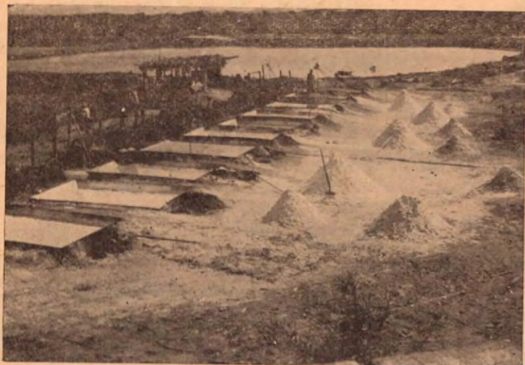
Pails secadoras de sal